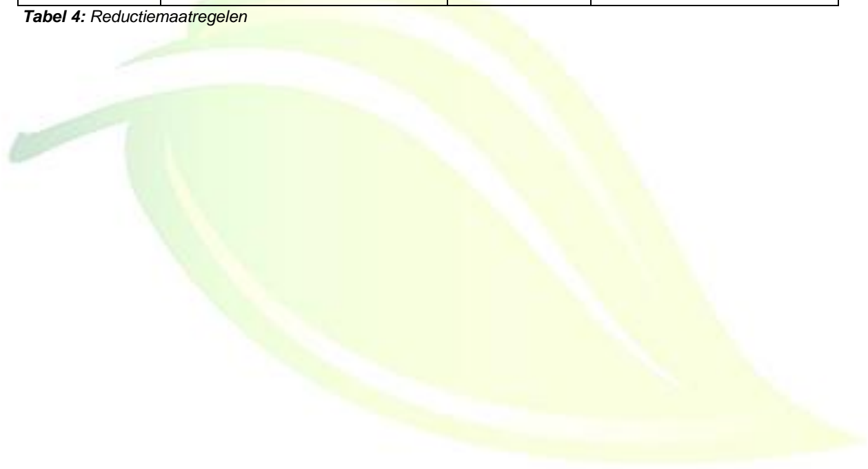
Tabel 4: Reductiemaatregelen